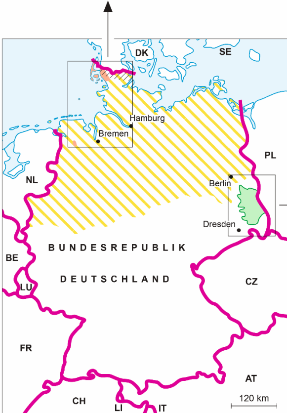
Deutsch-sorbische Sprachgebiete German-Sorbian language regions

Kartographie / Cartography: Bundesamt für Kartographie und Geodäsie, Frankfurt am Main, 2016