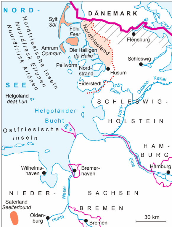
Deutsch-dänisches und deutsch-friesische Sprachgebiete German-Danish and German-Frisian language regions