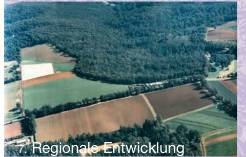
7. Regionale Entwicklung