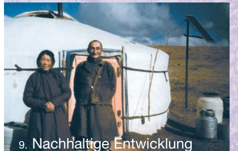
9. Nachhaltige Entwicklung